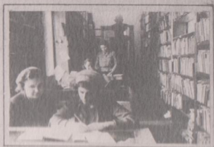
ВЫДАЧИ СПРАВКИ ЧИТАТЕЛЮ.