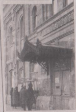
Свердловская областная библиотека.