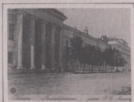
Биб-ка Кизлярского уя-Тя.