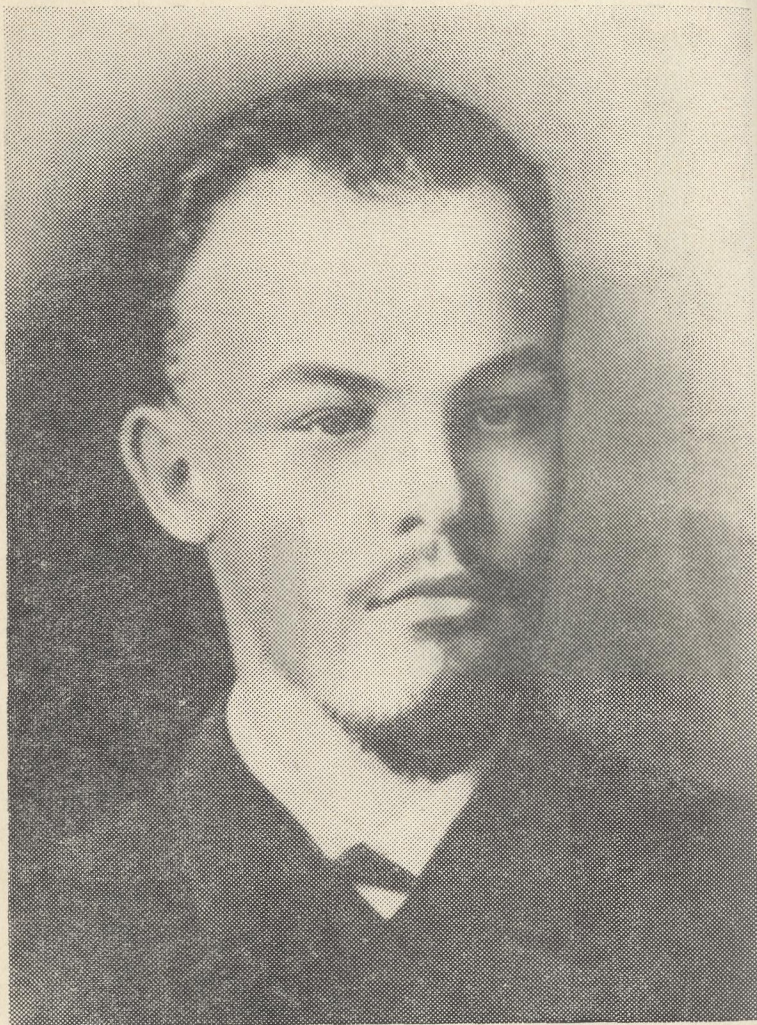
В. И. Ленин в 1890—1891 годах.