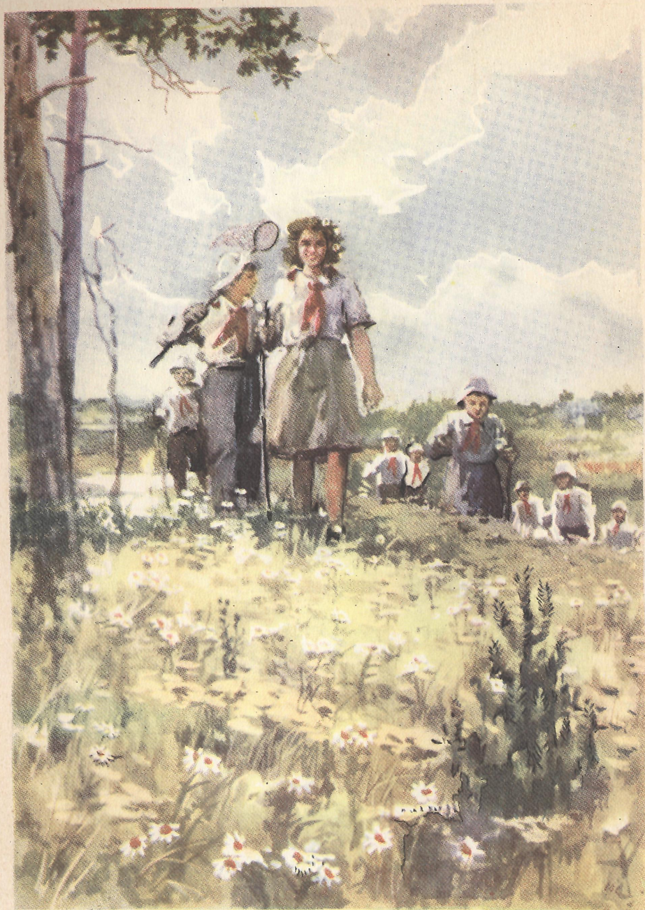
На охоту за растениями.