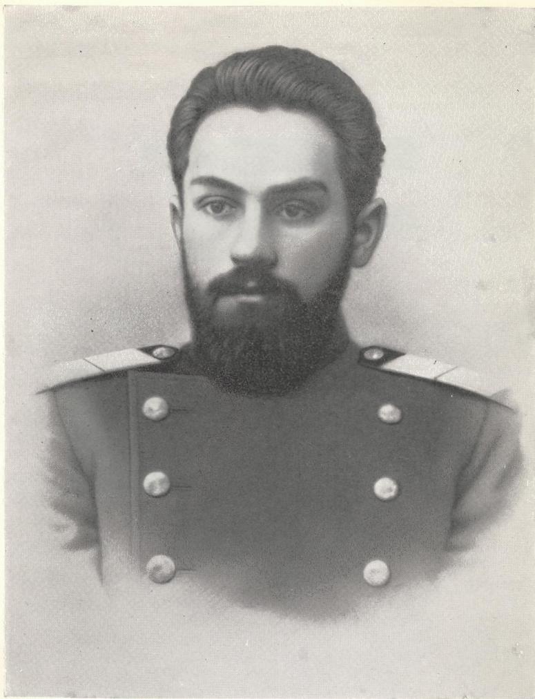
Л. А. Орбели в студенческие годы.