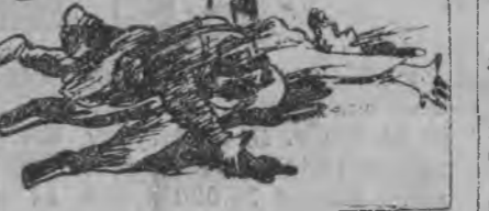
Французский передовой отряд отступил, эвакуировав все военные материалы.

ПАРИЖ. По сообщению из Феца, французские войска отбили атаку риффов на Марокко.