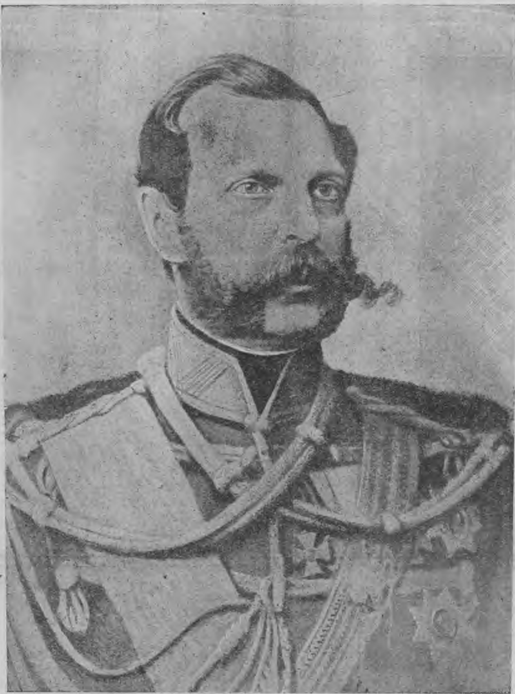
Императоръ Александръ II.