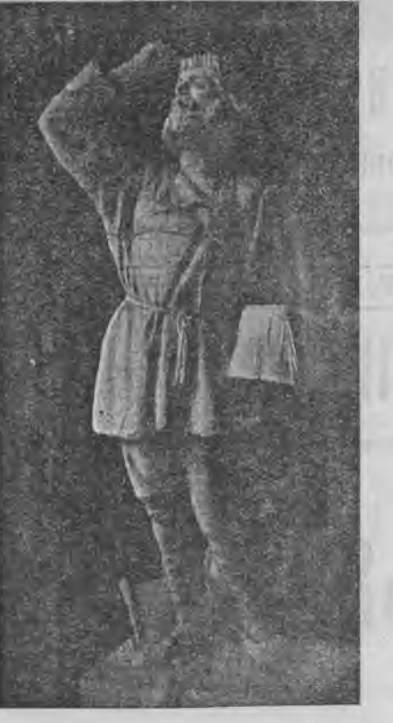
«Манифестъ 19-го февраля».