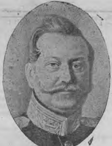
Графъ Иванъ Ивановичъ Ростовцевъ.