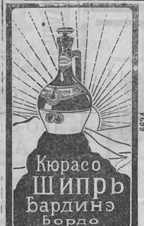
Кюрасо Ширри бардинэ Бордо

СДАЮТСЯ комнаты для няней. Дамы или барышни, полный комфорт. Волжская близъ Котляриной, № 51, кв. А. 8240