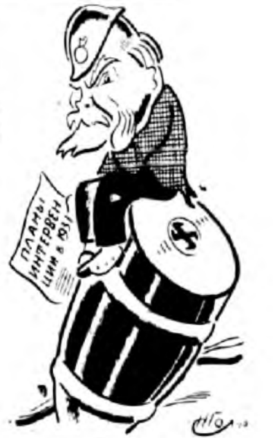
Раймонд Пуанкаре война

Мы призываем представителей науки и культуры, всех честных людей всех стран поднять свой голос протеста против неслыханного вторжения в мирную строительную работу великой страны со стороны тех, кому нужны новые рынки и колонии рабов.