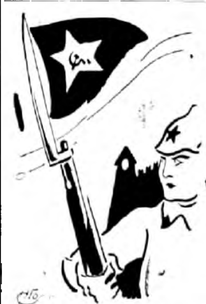
Боевой готовностью станем на защиту интересов мира

Прошедшая с 15 по 21 ноября декада обороны имени Ленина не только заострила внимание трудящихся на (вопросах обороны СССР, но должна была выявить подготовленность каждой организации к обороне, выявить резуль-