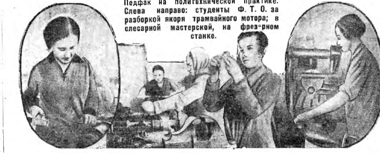
Педфак на полигехнической практике. Слева направо: студенты Ф. Т. О. за разборкой якоря трамвайного мотора; в слесарной мастерской, на фрезерном станке.

Типография Крайздата. Заказ № 52— Ниж.-вол. край. Лито № 95