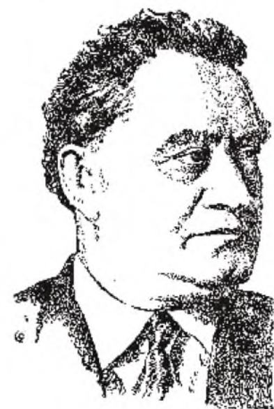
ГЕОРГИ ДИМИТРОВ Генеральный секретарь ИККИ

Блестяще оправдалась линия VII конгресса Коминтерна. Народный антифашистский фронт представляет собой гигантский шаг вперед в освободительном движении пролетариата. Мощная волна движения солидарности с героическим испанским народом, охватившая все страны мира, усилила во всех странах борьбу с собственной реакцией, со своим фашизмом, борьбу с фашистскими поджигателями войны. Во всех странах идет единая борьба мира против войны, демократии и прогресса против реакции и фашизма, народных масс против поджигателей войны и эксплуататоров.