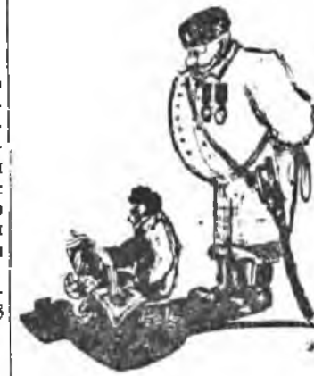
«Свободное» овладение науками.

(Постановление Совета Сарат. Ун-та от 19 янв. 1915 г.)