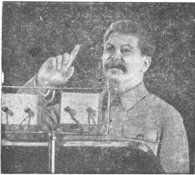
Выступление товарища И. В. Сталина на предвыборном собрании избирателей Сталинского избирательного округа гор. Москвы 11 декабря 1937 года в Большом театре.