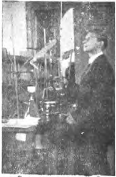
Работа в лаборатории химического факультета