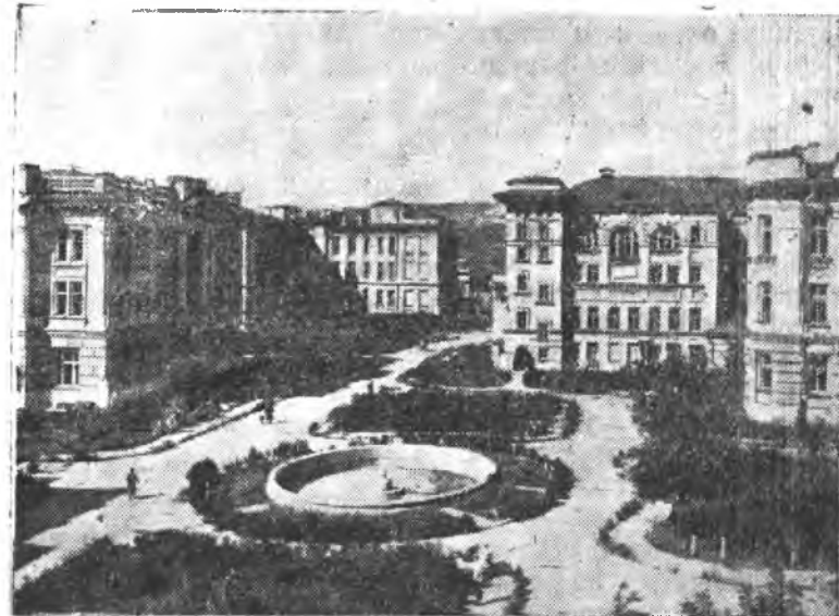
Саратовский государственный университет им. Н. Г. Чернышевского.