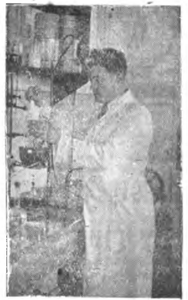
Работа в лаборатории биологического факультета

Университет обеспечен квалифицированным преподавательским персоналом: на 39 кафедрах работают: профессоров 21, доцентов 18, и. о. доцента 13, ст. препод. 18, ассистентов 37. В составе научных работников имеются 7 докторов наук и 28 кандидатов наук. Среди сотрудников немало молодых талантливых специалистов — воспитанников университета.