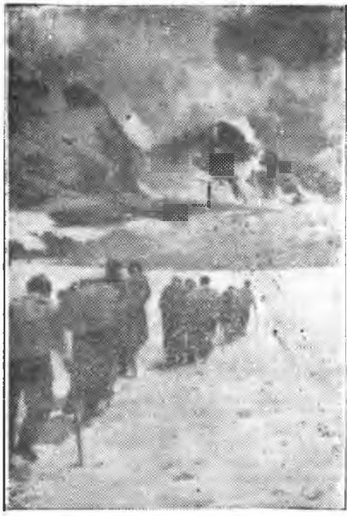
Высокогорная альпинистская экскурсия, в которой участвовали студенты СГУ. На снимке: альпинисты в походе.