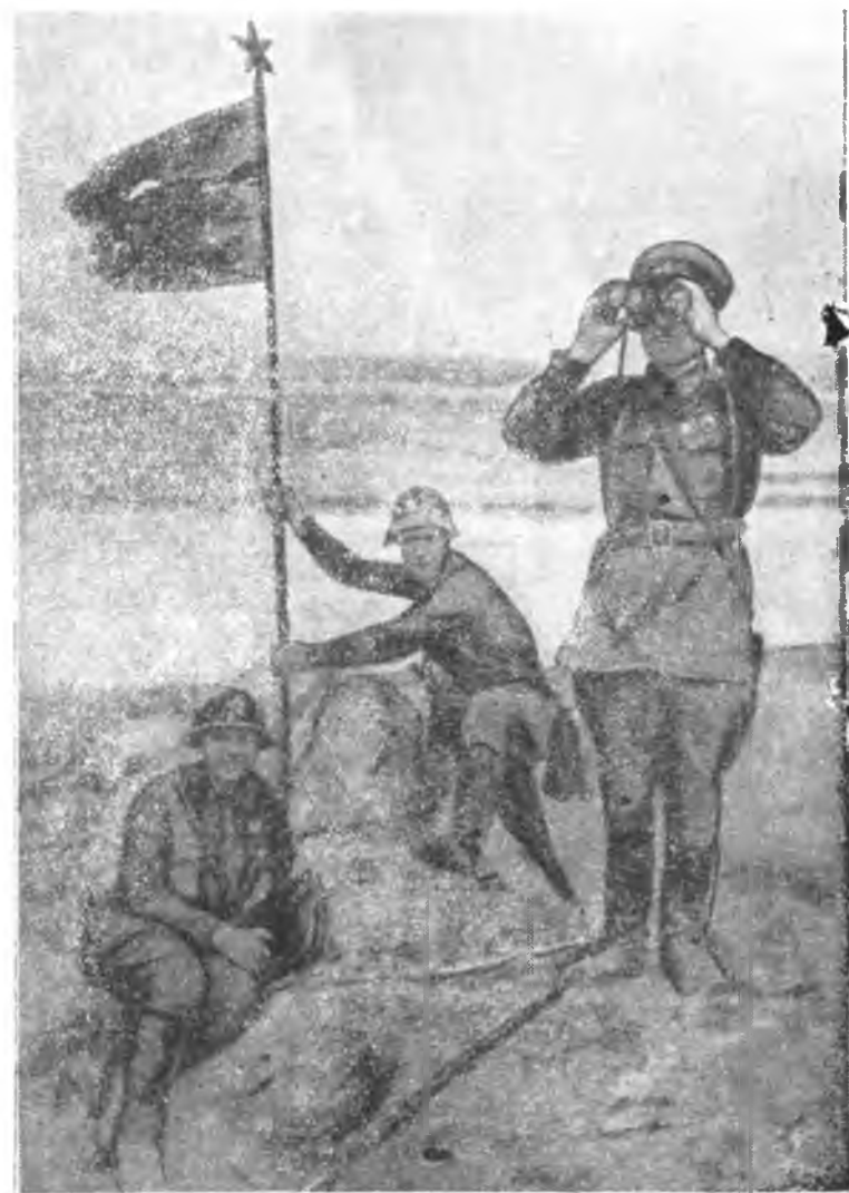
Бойцы краснознаменного дальневосточного фронта устанавливают на высоте Заозерной боевое знамя, пробитое пулями и осколками гранат.