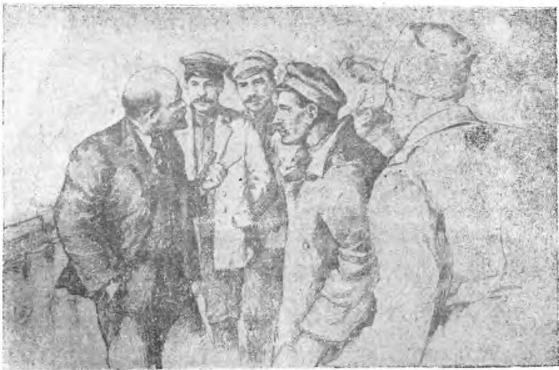
В. И. Ленин, И. В. Сталин и Л. М. Каганович на конференции военных организаций в 1917 году