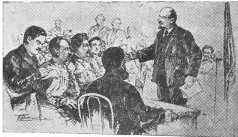
Ленин и Сталин на апрельской конференции 1917 г.