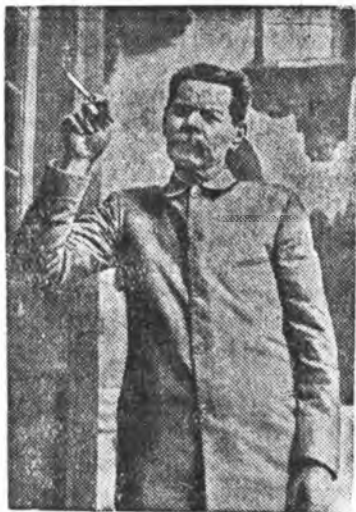
А. М. Горький (1934 г.).

В. И. Ленин не раз подчеркивал, что произведения Горького, и в особенности «Мать», сыграли немалую роль в развитии революционного движения в России. Это признают и писатели другого лагеря. Л. Андреев