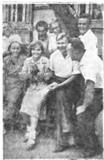
Празднование Международного юношеского дня в 1940 г. Студенты химфака перед выходом на демонстрацию.