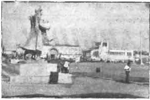
Москва—сердце народа, гордость народа. В 1940 году еще больше расцвела, обогатилась тысячами экспонатов Всесоюзная сельскохозяйственная выставка. На снимке: на площади колхозов 3 августа 1940 года.