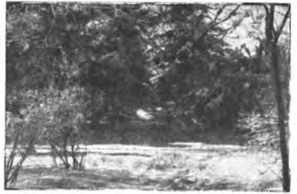
Зима... Нарядно выглядят окрестности города. С ветвистых деревьев свисают снежные гирлянды. Но лес не хранит свое традиционное молчание. С утра до ночи здесь слышатся веселые голоса лыжников.