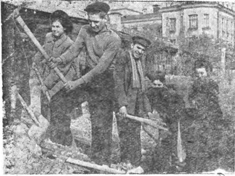
На снимке: комсомольцы филологического факультета на строительстве нового корпуса Университета.

Ясное осеннее утро. В воздухе бодрящая прохлада, — день обещает быть солнечным и по-весеннему теплым.