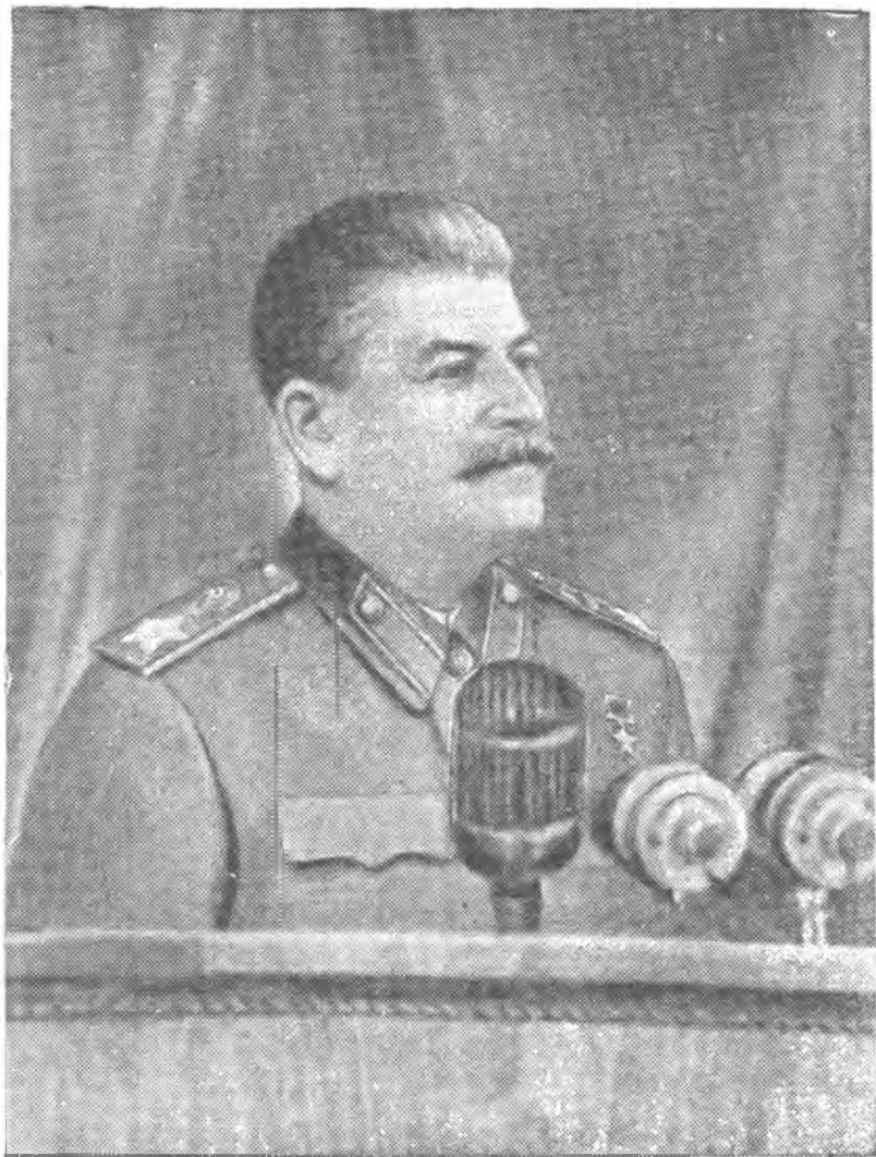
Выступление товарища И. В. Сталина на предвыборном собрании избирателей Сталинского избирательного округа г. Москвы 9 февраля 1946 года.