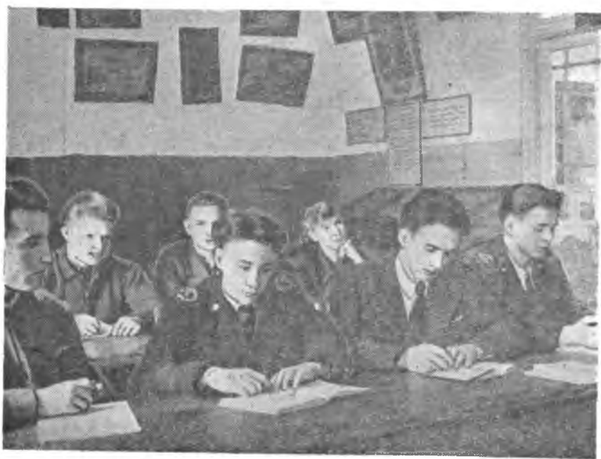
На IV курсе геологического факультета есть группа геофизиков. По успеваемости она лучшая на факультете. Четыре человека в группе отличники, — остальные имеют только хорошие и отличные оценки. Все студенты ведут общественную работу. На снимке: группа геофизиков слушает лекцию по геологии Советского Союза.