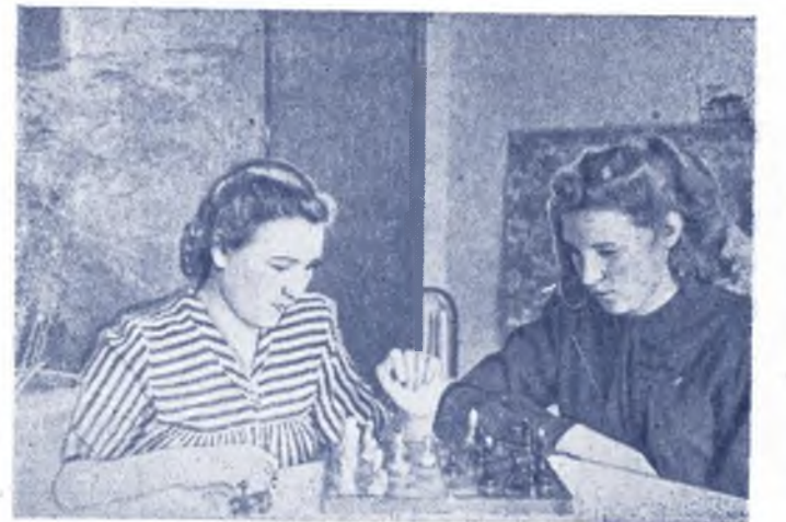
Культурный отдых — хорошая заправка для учебы. Завтра студенты снова заполнят просторные аудитории и начнут свой новый трудовой день.

В одном из лучших общежитий университета живут девушки. В Красном уголке можно часто встретить молодежь, играющую в шахматы. С большим удовольствием девушки читают книги наших писателей и часто бурно обсуждают их.