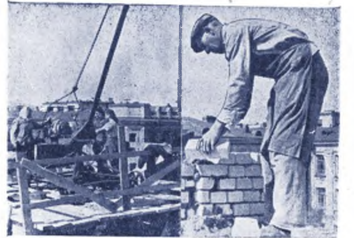
Немалую помощь этим стройкам оказала общественность университета в лице служащих, научных сотрудников и студентов. Вот и сегодня здесь хорошо потрудились студенты III курса химического факультета.

Книгохранилища будущей библиотеки смогут вместить до двух миллионов книг, а шесть читальных залов удобно разместят свыше 700 читателей.