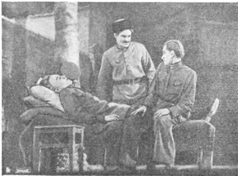
В университете широко развита художественная самодеятельность НА СНИМКЕ: сцена из спектакля лауреата Сталинской премии Павленко «Счастье», поставленного кружком художественной самодеятельности.