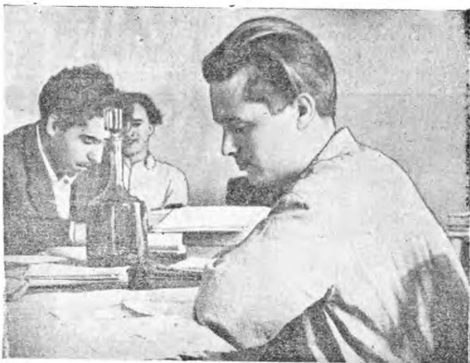
По вечерам студенты занимаются в красных уголках университетских общежитий. Здесь они готовятся к семинарам и экзаменационным сессиям. На снимке: Студенты V курса занимаются в красном уголке общежития № 2.

произведения товарища Сталина в различных изданиях.