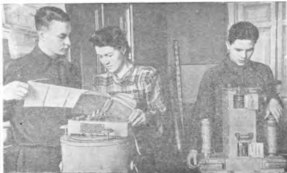
Студенты в геофизической лаборатории.

Научное студенческое общество насчитывает в настоящее время более 400