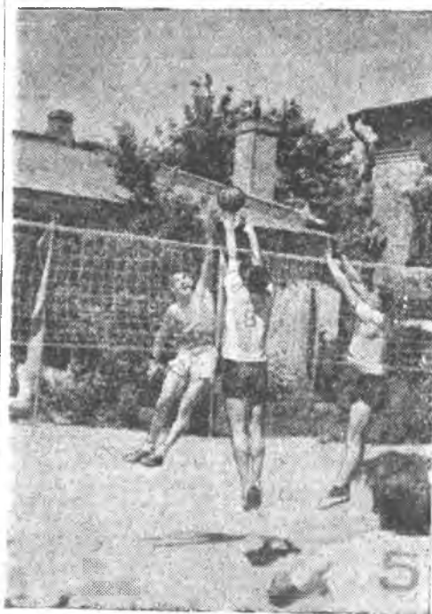
Волейболисты физического факультета по праву считаются сильнейшими в университете. В этой году мужская и женская команды физиков заняли первые места в университете. На снимке: момент игры чемпиона СГУ — I-й команды физического факультета с I-й командой геологов.