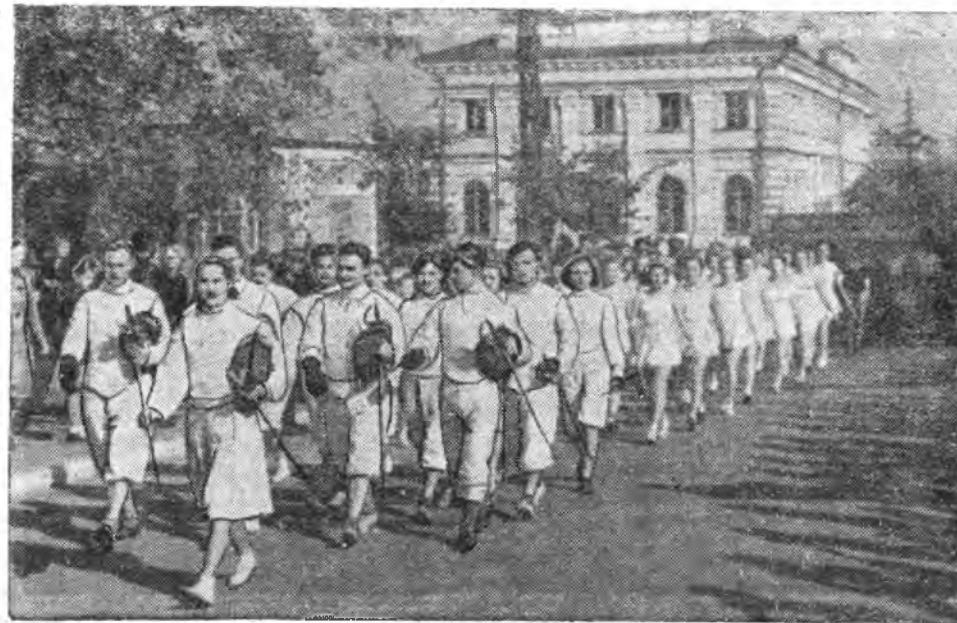
На снимке: участники праздника — члены спортивных секций фехтования и художественной гимнастики — проходят по центральным улицам города.