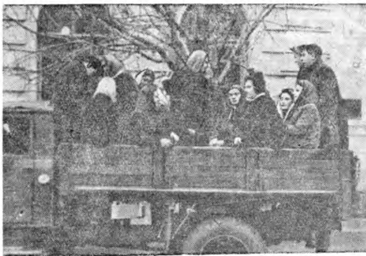
Студенты исторического факультета оказывают действенную помощь лесозащитным станциям. На снимке: студенты 4 курса исторического факультета отправляются на работу в ЛЭС.