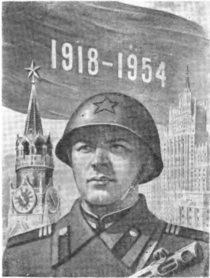
Рисунок Н. Павлова.

Год изд. 20-й | № 7 (529) | Суббота, 20 февраля 1954 г. | Цена 20 коп.