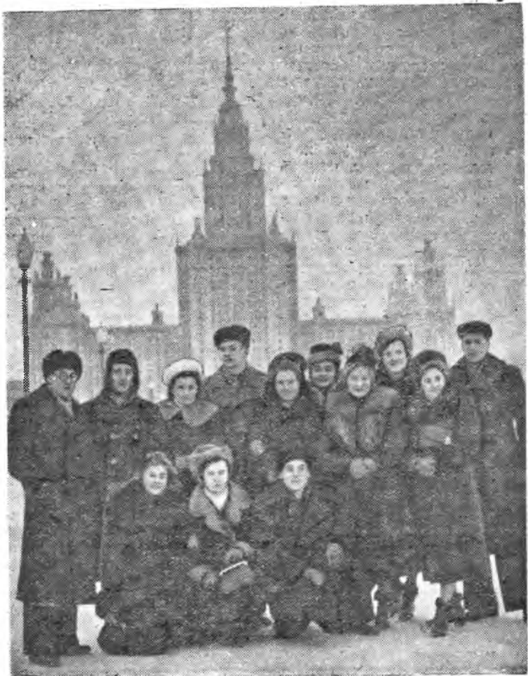
На снимке: наши студенты-экскурсанты около здания Московского университета на Ленинских горах.