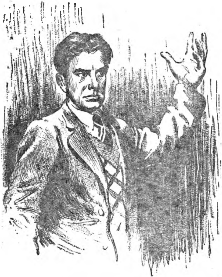
Рисунок В. Киселева

(К 25-летию со дня смерти В. В. Маяковского — 14 апреля 1930 года)