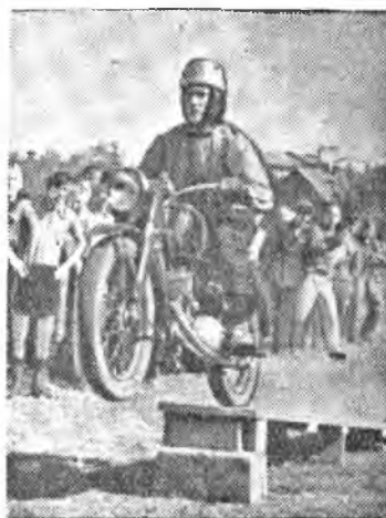
Его работе каждый знает цену. И книга и мотор ему друзья... Ведь можно быть филологом-спортсменом. Но быть спортсменом в филологии нельзя. Текст Корнея ШИЛО. Рисунки Г. СМЕРНОВОЙ.