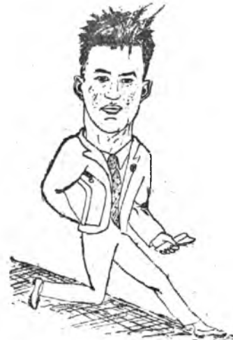
Усталый вид, И ноги заплетаются... Бюро сидит, А он за всех старается...