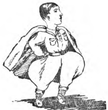
Всегда и повсюду в великой работе... Он занят делами... Горит на работе... Армейская поступь... Настоящий вид. Такой никогда и нигде не стогрит