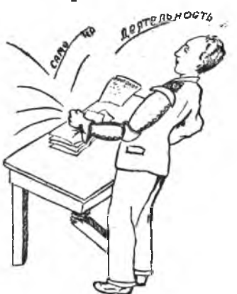
Многочисленный, не много полезный, Делает дело «рукою железной». Если помягче он делал бы дело, Не было б этому делу предела.