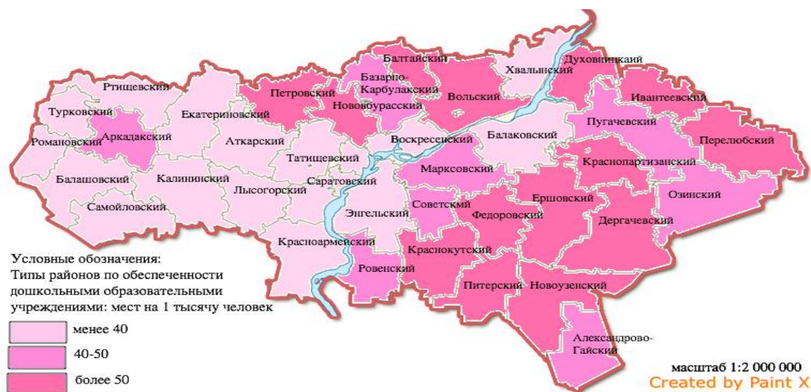
Рисунок 1- Обеспеченность муниципальных районов Саратовской области детскими образовательными учреждениями , 2013 г. (составлен автором по материалам: [15]).

В ходе исследования мы рассмотрели динамику обеспеченности населения местами в детских садах в динамике за 2013 и 2015 гг. по муниципальным районам Саратовской области.