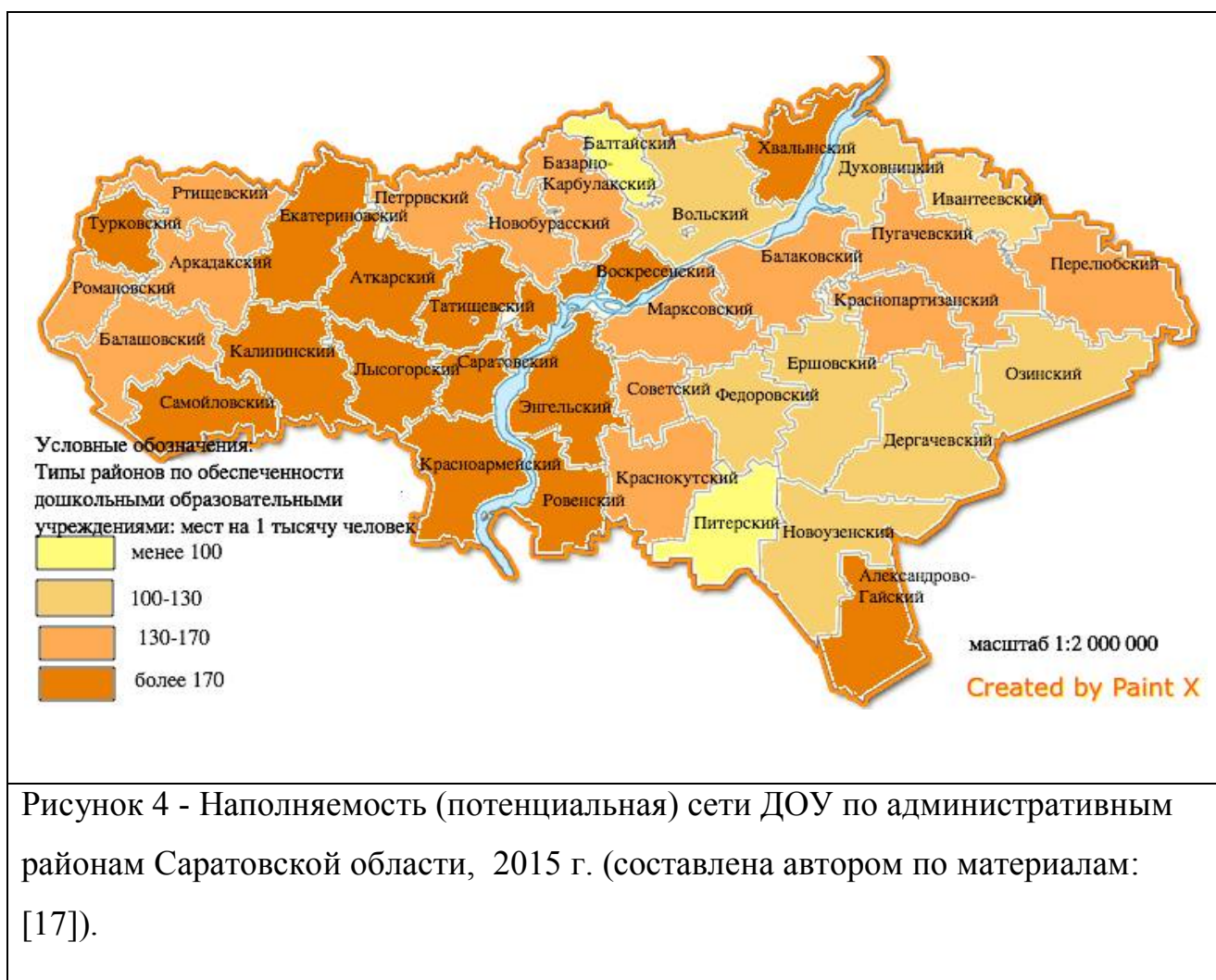
Рисунок 4 - Наполняемость (потенциальная) сети ДОО по административным районам Саратовской области, 2015 г. (составлена автором по материалам: [17]).

Районов со свободными местами в детских садах немного: в 2013 г. их было пять, в 2015 г. стало два, большинство находится в Левобережье. Тип районов где есть свободные места в детских садах, исчезает.