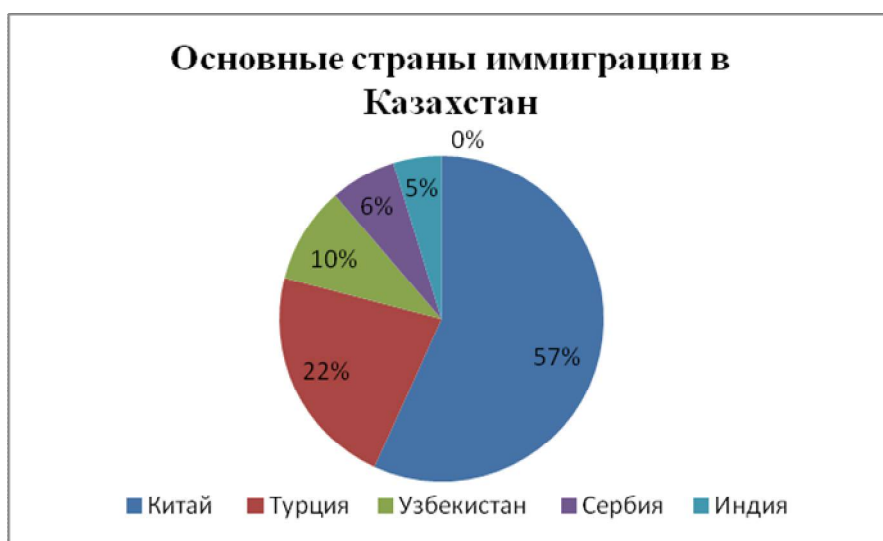
Рисунок 3 –Основные страны притока иммигрантов в Казахстан (составлен автором по материалам [7])

приезжали из Турции и составляли от одной трети до половины всех иностранных граждан, работавших в стране. С 2010 года Китай занял первое место по количеству иностранных работников.