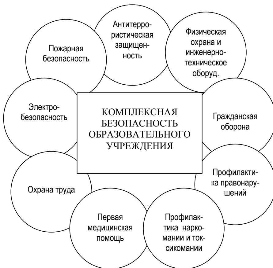
Рисунок 1 - Модель комплексной безопасности образовательного учреждения

4. Совершенствование элементов современного оборудования и средств обеспечения безопасности школы.