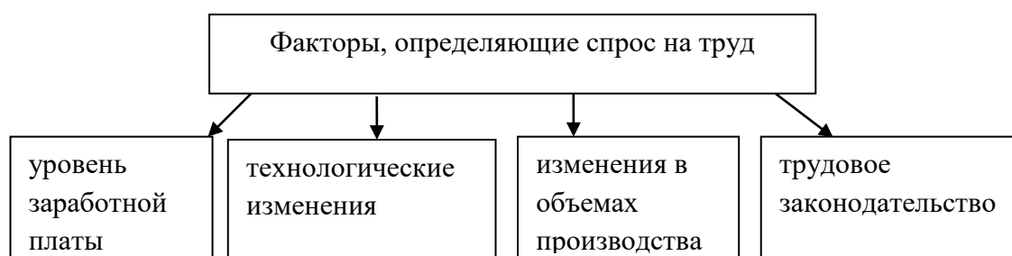
Рисунок 2 – Факторы, определяющие спрос на труд 2

Спрос на рабочую силу отражает потребность экономики в определенном количестве работников на каждый данный момент времени. В связи с этим на макроуровне выделяют факторы, определяющие спрос на труд, которые могут влиять на него как одновременно, так и в отдельности.