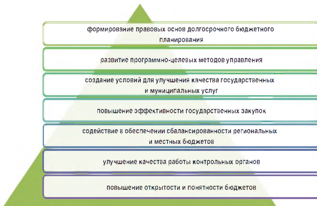
Рисунок 1 - Основные задачи бюджетной политики 2 .

Эффективность бюджетной политики непосредственно связана с последовательностью этапов ее разработки и их содержанием.