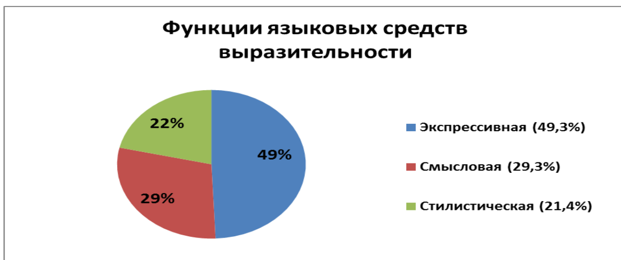
Таблица № 3. Процентное соотношение языковых средств выразительности в соответствии с выполняемой ими функции.

Смысловая функция не характерна для фигур речи, т.к. они представляют собой синтаксические конструкции, не отличающиеся особой смысловой нагрузкой. Экспрессивная функция является основной функцией языковых средств выразительности, и встречается чаще остальных, т.к. любое выразительное средство: тропы или фигуры – способствует выразительности, экспрессивности и наглядности текста, т.е. выполняет экспрессивную функцию.