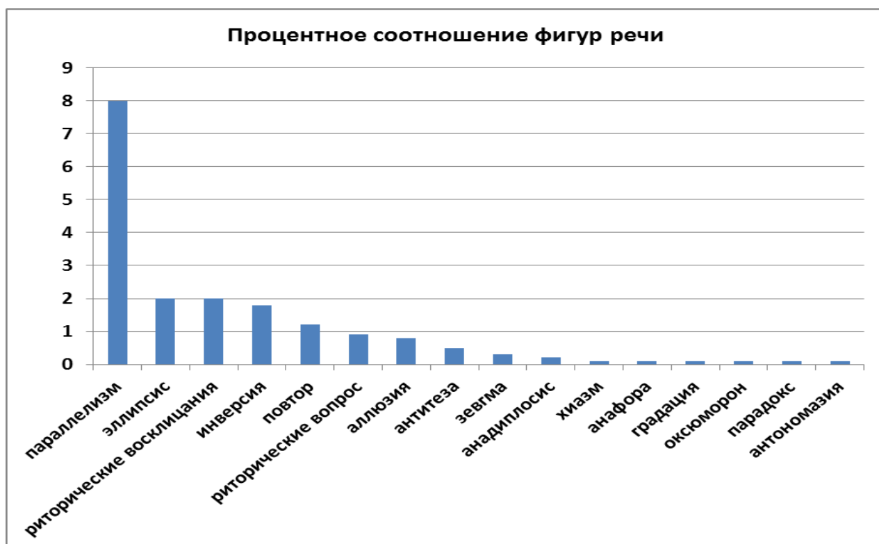
Таблица № 2. Процентное соотношение фигур речи в романе М. Твена «The Adventures of Tom Sawyer».

Анализ функциональной принадлежности языковых средств выразительности, представленных в исследованном романе, позволяет заключить, что подавляющее количество языковых средств выразительности (49,3%) выполняют экспрессивную функцию, т.е. способствуют отражению авторского видения предмета, выражению оценки или отношения к предмету, отражению внутреннего состояния персонажей, а также изображению предметов с непривычной стороны. Исходя из результатов исследования, далее идут средства выразительности (29,3%), выполняющие смысловую функцию, т.е. способствующие передаче новой смысловой нагрузки слова. Наименьшее количество выразительных средств (21,4%) выполняют стилистическую функцию, т.е. помогают автору придать определенную стилистическую окраску тексту, а также способствуют созданию комического эффекта.