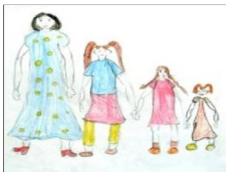
Рис. 3. Неполная семья, нет отца

Полученные данные говорят том, что на рисунках у детей из неполных семей нет изображения отсутствующего родителя или же его изображение находится в отдалении от других членов семьи (см. рис. 3).