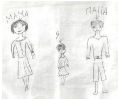
Рис.6. Полная семья (родители друг от друга отдалены)

Таким образом, результаты анализа рисунков подтверждают предположение о том, что статус семьи, состоящий в ее полноте или смешанности, является важным фактором, влияющим на такие эмоциональные проявления детей, как агрессивность, тревожность.