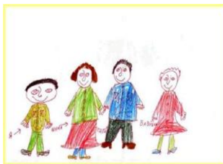
Рис. 5. Полная семья

Радость жизни, которую испытывают дети из полных семей видно из рисунков на которых отражается чувство общности семьи, так как дети не отдаляли членов семьи друг от друга (см. рис. 5).