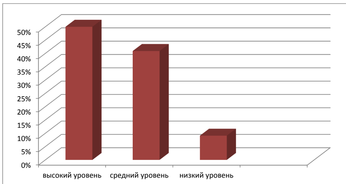
Рисунок 2 – Уровень сформированности межличностных отношений у детей на итоговом этапе исследования

Более наглядно представим полученные результаты в виде диаграммы (см. рис. 2).