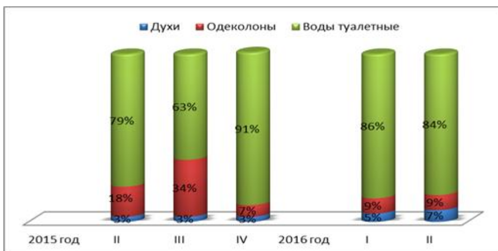
Рисунок 3.1.3 - Структура производства парфюмерии по товарным категориям РФ во 2 квартале 2015 г. – 1 квартале 2016 г., в натуральном выражении (составлено автором по материалам [19]).

Согласно общепринятой классификации, выделяют три типа парфюмерии: к ним относятся непосредственно парфюм (духи), парфюмированная вода и туалетная вода [19].