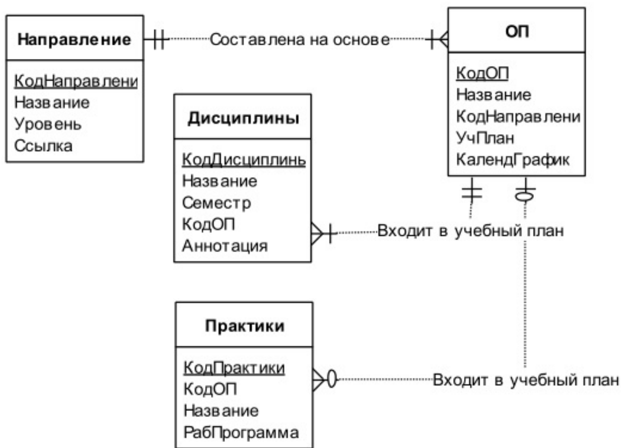
Рисунок 1: Инфологическая модель

И приводятся соответствующие диаграммы и схемы. Такие как инфологическая модель 1 подраздела, которая была описана в работе «Об автоматизации заполнения подраздела «Образование» сведений об образовательной организации на официальном сайте вуза», и ER-диаграмма 2, которую мы затрагивали в «Разработка инфологической модели для аис подраздела «Образование» специального раздела официального сайта вуза».