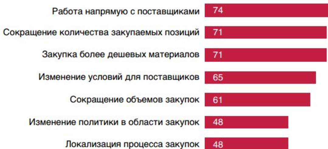
Рисунок 2 - Основные меры по сокращению расходов на закупки, % 6

Как видно из рисунка 2, компании, как правило, сокращают расходы на основные материалы, включая те, которые используются в процессе создания собственной стоимости (сырье, полуфабрикаты, товары для перепродажи и пр.). Однако меньшее внимание уделяется косвенным расходам, таким как материалы для собственного использования, внутренний транспорт, аренда.