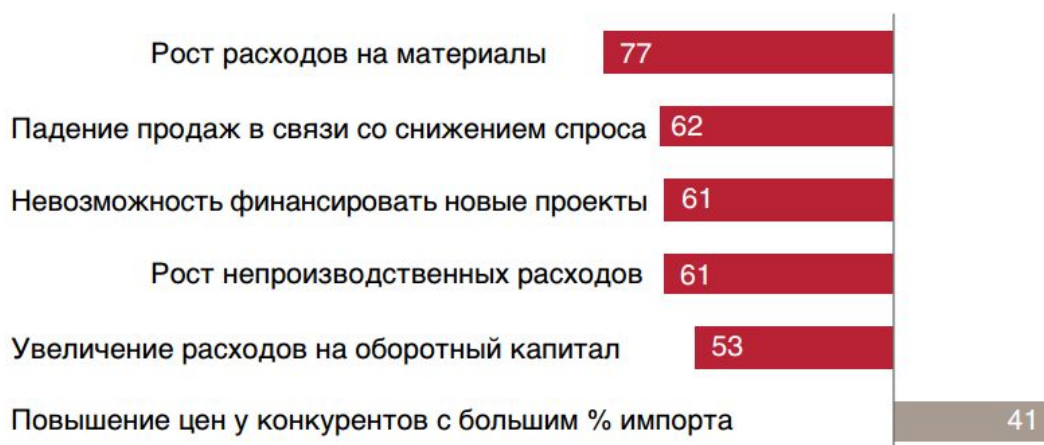
Рисунок 1 - Факторы, оказавшие наиболее сильное отрицательное и положительное воздействие в условиях кризиса, % 4

импортируемых товаров и материалов. Некоторые крупные российские компании также сообщили о том, что ослабление рубля позволило им увеличить объем экспорта.