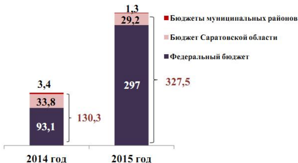
Рисунок 2 – Финансирование мероприятий по оказанию государственной поддержки бизнеса, млн. рублей 4

бюджета; 1,3 млн. рублей – средства местных бюджетов.