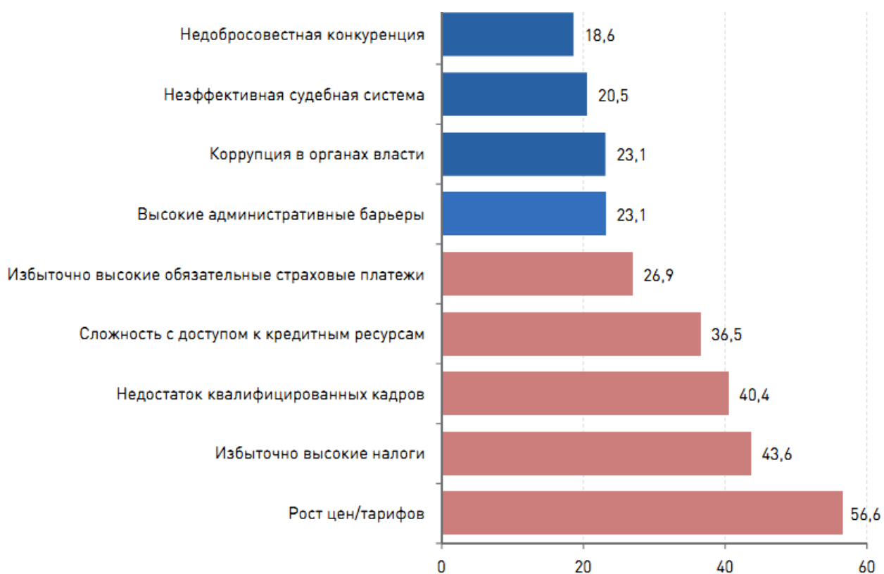
Рисунок 3 – Наиболее острые проблемы для бизнеса в 2015 году, % 6

В докладе Российского союза промышленников и предпринимателей «О состоянии делового климата в России в 2015 году» говорится, что в ТОП-5 наиболее острых проблем, мешающих предпринимательской деятельности в России, вошли рост цен, избыточно высокие налоги, недостаток квалифицированных кадров, сложность с доступом к кредитным ресурсам и избыточно высокие страховые платежи 5 .