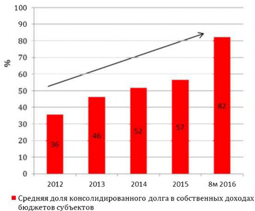
Рисунок 1 – Анализ доли долга в собственных доходах региональных бюджетов 1

Кредитная нагрузка на бюджеты при этом растет преимущественно за счет увеличения доли долга перед федерацией – этими заимствованиями, которые выдаются на сверхльготных условиях, замещаются дорогие коммерческие кредиты и частично компенсируется уменьшение трансфертов (см. рис. 2).