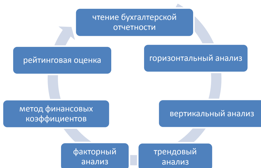
Рисунок 3 - Методы финансового анализа

Финансовый анализ проводится с использованием следующих показателей: