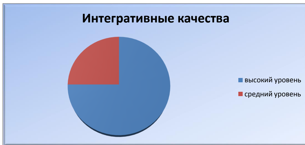
Рисунок 2 – Результаты мониторинга детского развития

только 5 детей (25 %) – средний уровень; низкий уровень развития не был выявлен.