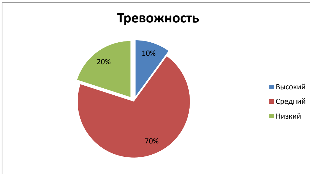
Рисунок 2 - Результаты изучения уровня тревожности в 5 классе