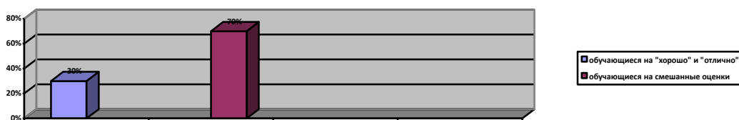
Рисунок 1 - Анализ успеваемости младших школьников.

Результаты методики «Диагностика структуры учебной мотивации школьника М.В. Матюхиной» позволили изучить структуру учебной мотивации школьника, определить дополнительные мотивы учения.