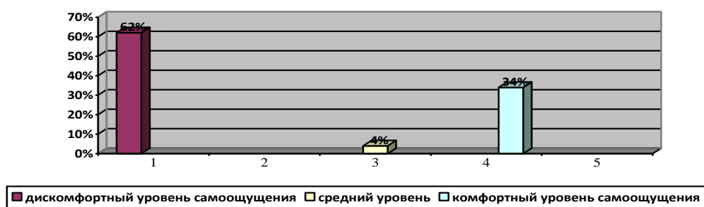
Рисунок 3. Результаты проективной методики «Школа зверей» (самоощущение).

Интерпретируя рисунки по методике «Школа зверей» нами были выделены пять групп по характеристике самоощущения учащихся в школе.