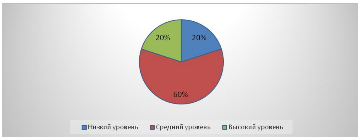
Рисунок 2 – Распределение детей по уровням речевого развития на контрольном этапе исследования, (%)

Таким образом, можем сделать вывод, что большинство детей по-прежнему обладают средним уровнем речевого развития, однако увеличилось количество детей с высоким уровнем развития речи, и уменьшилось количество детей с низким уровнем.